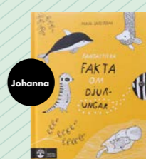
Alla böcker av Maja Säfström! av Maja Säfström