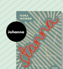
Stanna av Flora Wiström