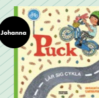
Puck lär sig cykla av Anna-Karin Garhamn