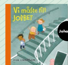
Vi måste till jobbet av Pija Lindenbaum