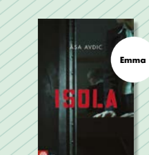
Isola av Åsa Avdic