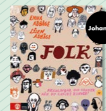
Folk av Emma Adbåge