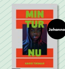
Min tur nu av Angie Thomas