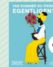
Var kommer du ifrån, egentligen? av TNKVRT