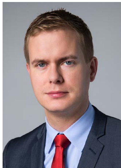
Gustav Fridolin.

Språkrör, minister, utredare, lärare, elev. Gustav Fridolin har sett Sveriges skolbibliotek ur många perspektiv. I januari presenterade han sin utredning för att stärka bibliotekens roll i skolan. Målet: En mer likvärdig tillgång och att bidra till elevernas utbildning och bildning.