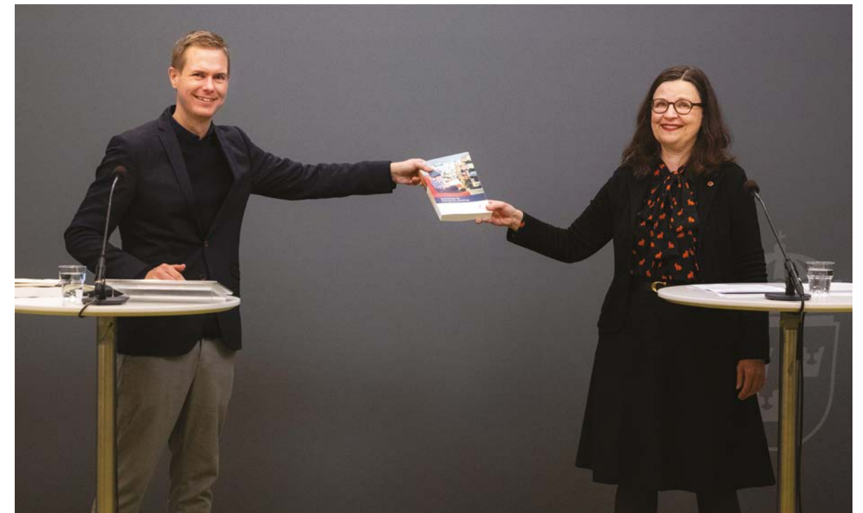
Gustav Fridolin levererar skolbiblioteksutredningen till Utbildningsminister Anna Ekström.

biblioteksverksamhet (VALS), med ett antagande om att lärarna som går utbildningen i många fall fortfarande delvis bedriver undervisning.